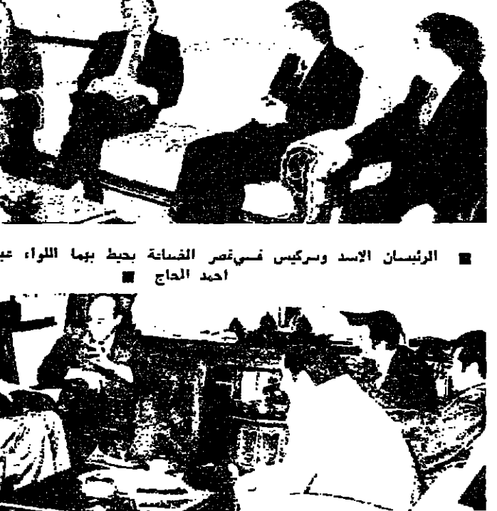
الرئيسان الاسد وسركيس في عصر الضخامة يحيط بهما اللواء عبدالرحمن خليفاني ، الوزير بطرس ، احمد الحاج

قمرات في « الانوار » ان ذهب سوق الصاغة في بيروت يلجح الآن في جوبيته ، بانتظار اعادة بناء السوق الاترية . الصحيح انه يلجح كذلك في صيدا وفي كل مكان . حتى في الضيقة طلع عنقنا محلات من احلى ما يكون ، واضمح بالمكان الحسان ان يقطن احلامهم دون التعرض الى مشقة النزول الى العاصمة . ومع احلام الحسان انتقلت الى شتى المناطق اللبنانية ، في الجبل والساحل ، بضائع كثره ونشاطات لا عد لها ولا حصر . فضلا عن اللبنانيين انفسهم الذين كانوا يمشون في المدينة يعيشون كالمصريين ، فنقلوا سكاثم الى حيث ينتشرون الهواء ويرون وجه الشمس . لا مركزة اوجدتها الحروب . واذا كان لكل مصيبة تقع فمن منافع هذه الحرب انها خففت الضغط الذي كان يفتق العاصمة ويخفق . وقد كان ، هو الآخر ، من اسباب الانفجار . آفة العواصم في عصرنا انها تنبع ما عداها من المدن ناهيك بالارياق . وهي مشكلة عالمية تصدى لها لسان السياسة والخبز واصفونها كزوم علاج . الملاجها جاعنا من السماء - يجب ان اقول من جهنم ، والحياد بالكلية . ينبغي توجيهها بما يلزم ، فتعدى المتاجر والمصانع والمسكن الى نواتج الدولة . بل ان توزيع تلك المرافق بالذات سيقرض توزيع السلطة . واذا لم تكن السلطة لرعاية كل ذلك فلاي شيء تكون ؟ لا مركزة ادارية ؟ لا مركزة سياسية ؟ الحدود بين الاثنين ترسمها حاجات الناس وعبر الحرب . تلك خره العميم ، ويلجح ذهبه في النتيجة من جوبيته الى صيدا ، مورا بيروت ، ومن النافورة الى النهر الكبير .